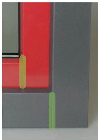
Eckausbildung Stumpfer Stoß (Standard)