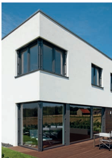
Modernes Einfamilienwohnhaus in Gießen, Deutschland