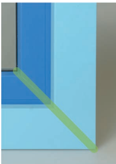
Eckausbildung Gehrung 45°