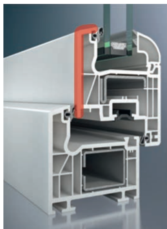
CT 70 Classic