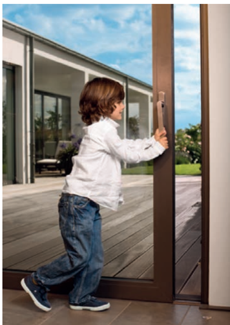
Fließende Übergänge zwischen Wohnraum und Terrasse.